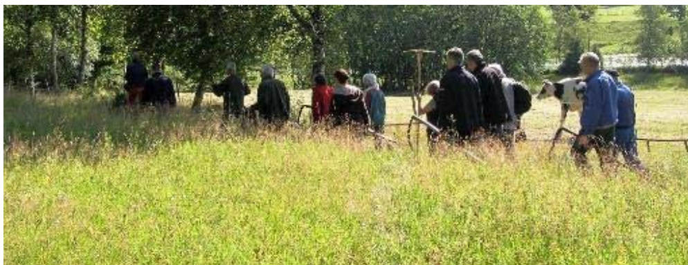
Slåtterfolk i Komstad